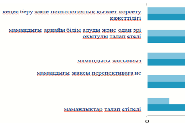
2-Сурет. Қазақстандағы әлеуметтік жұмыскерлер еңбегінің қажеттілігінің салыстырмалы сарапталуының диаграммасы.