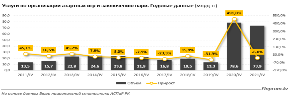
Рисунок 1 – «Услуги по организации азартных игр и заключению пари, млрд.тенге» [31]