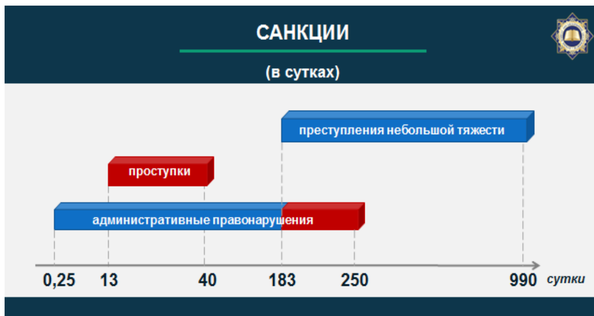
схема № 2

Сравнение средней оценки общественной опасности показало, что 304 административных состава находятся на одном уровне с проступками (в пределах от 12,5 до 37,5 у. ед.), а 90 - превышают их по тяжести (от 40 у. ед. и выше) (схема №2).