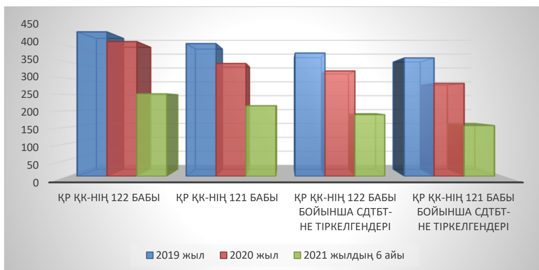
Сурет 1 – ҚСЖАЕК ресми есебінің көрсеткіштерінен

Статистикалық мәліметтерге сүйінсек, ең үлкен көрсеткіш үлесі Қазақстан Республикасы Қылмыстық кодексінің (бұдан әрі – ҚК) 122-бабы (44%) бойынша он алты жасқа толмаған адаммен жыныстық қатынас немесе сексуалдық сипаттағы өзге де әрекеттер жасау құрамындағы тіркелген қылмыстарға келеді. Ал, екінші кезекте сексуалдық сипаттағы зорлық-зомбылық әрекеттерін (ҚР ҚК 121-бабы) құрайтын қылмыстар орын алады (42%).