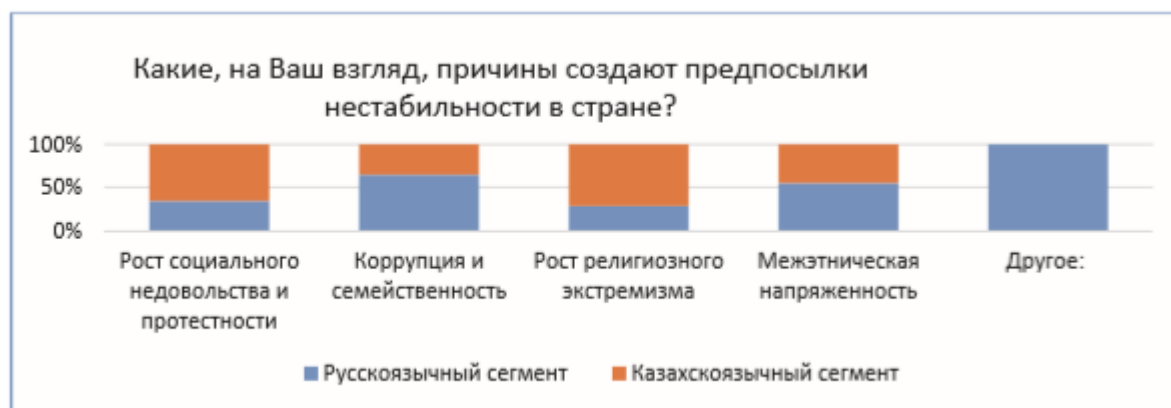
Рисунок 3 – Казахстанцы о предпосылках нестабильности (2017г.) [35]

Проблема религиозного экстремизма находит свою актуализацию в казахскоязычном сегменте опрошенных казахстанцев (19,9%), которые при этом вдвое ниже оценивают угрозы роста протестности и коррупции (рисунок 3).