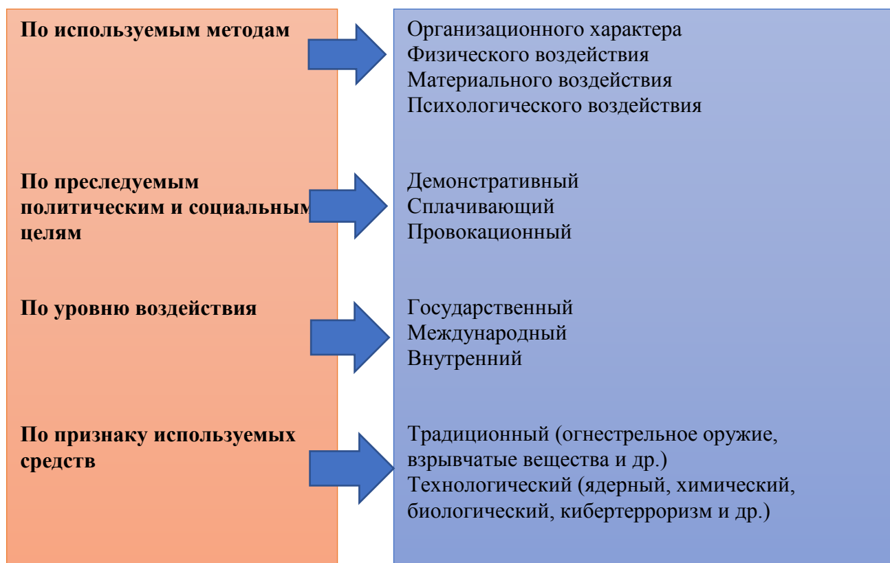
Рисунок 2 – Виды терроризма

социально-гуманитарных знаний. Таким образом, М.В. Розин предлагает технократическую концепцию существующего терроризма, правильно предполагая, что терроризм в настоящее время в значительной степени создаёт террористическую угрозу, главным образом благодаря применению технических инноваций [34, с. 126-135].