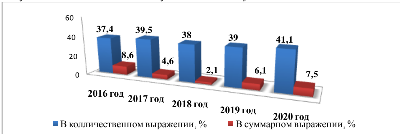
Рисунок 3- Исполняемость документов по Республике

Таким образом, в целом эффективность исполнения по республике остается на низком уровне, о чем свидетельствуют статистические данные, представленные в диаграмме (Рисунок 3).