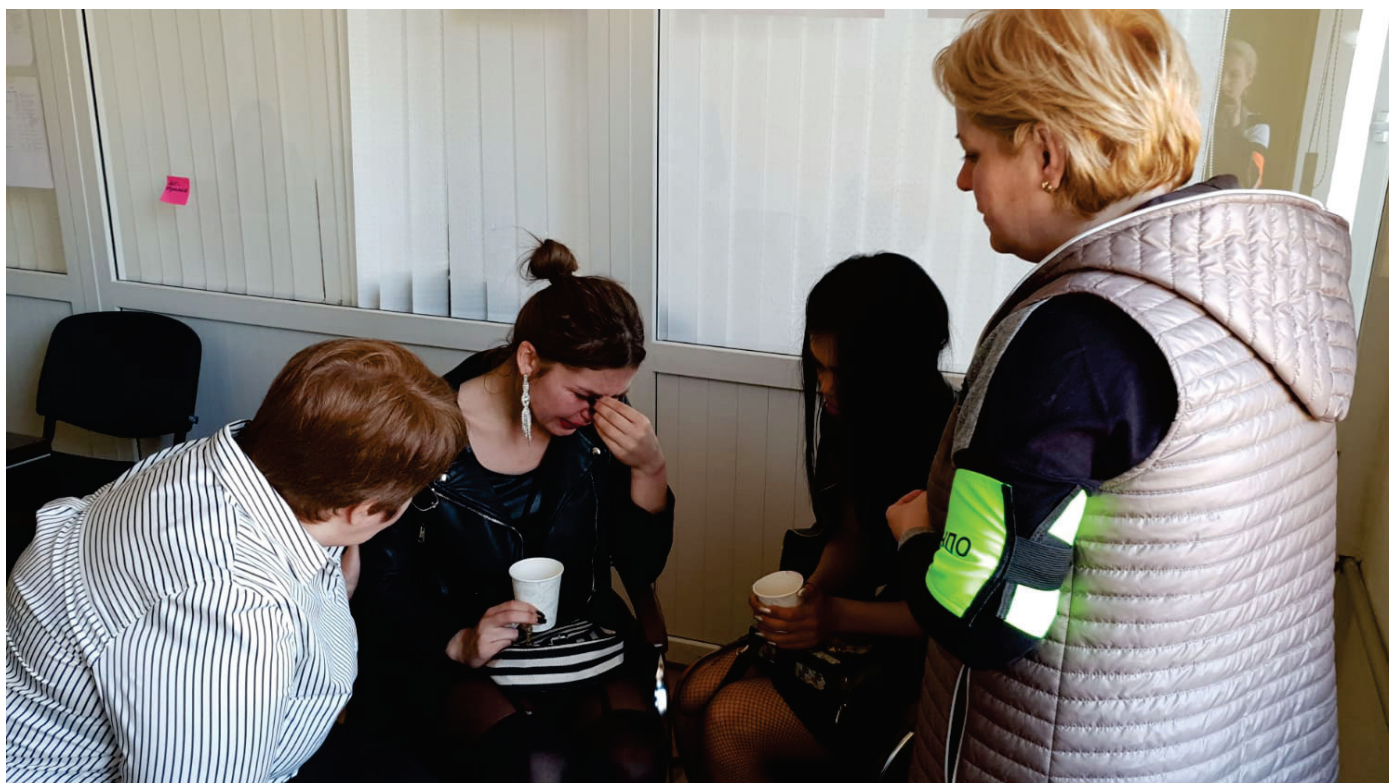
Работа психологов с жертвами торговли людьми

Одной из особенностей указанных тренингов явилось то, что злоумышленников и жертв преступления играли профессионально обученные актеры. При проведении первого тренинга все роли сыграли студенты Национального Университета искусств «Шабьт» и слушатели третьего курса Карагандинской Академии МВД им. Б. Бейсенова. Дебют состоялся и у сотрудников НПО «Қорғау», сыгравших роль главных организаторов преступления. Для сведения сценария воедино и проведения репетиций с актерами были приглашены профессиональные режиссеры. Актеры,