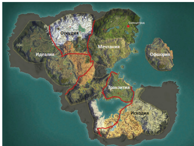
Карта вымышленных государств

Учитывая, что в тренинге участвуют представители разных государств с различным законодательством, разработчиками была создана вымышленная страна Мечтания со столицей в г. Солнцеграде, которую окружают страны с более или менее благополучной обстановкой, с низким уровнем доходов, а также зоны