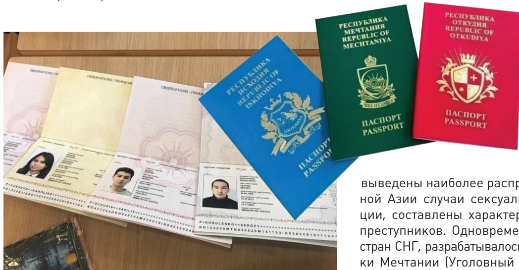
Документы граждан вымышленного содружества

конфликтов (Откудия, Идеалия, Офшория, Транзития, Исходия).