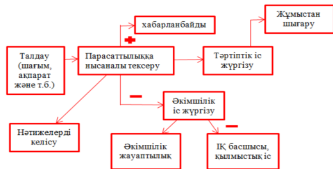
1-сурет. Парасаттылыққа тексеру тетігінің қазақстандық үлгісі

Үлгілер 2023 жылғы 10 наурызда барлық мүдделі мемлекеттік органдар мен үкіметтік емес ұйымдардың қатысуымен жиналыста ұсынылды. Жиында айтылған ұсыныстар мен мүдделі мемлекеттік органдардың ұстанымдарын, шетелдік тәжірибені ескеріп, парасаттылыққа тексеру тетігі (Integrity Check) әзірленді.